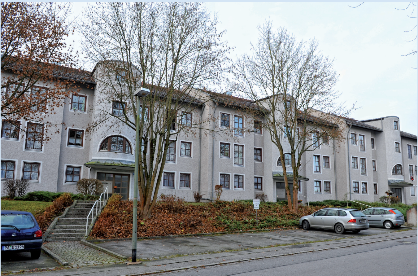
WOHNANLAGE OBERE SCHNECKENBERGSTRASSE 81-85 IN PASSAU-GRUBWEG