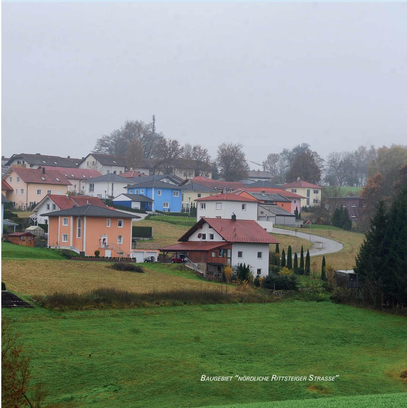
BAUGEBIET "NÖRDLICHE RITTSTEIGER STRASSE"