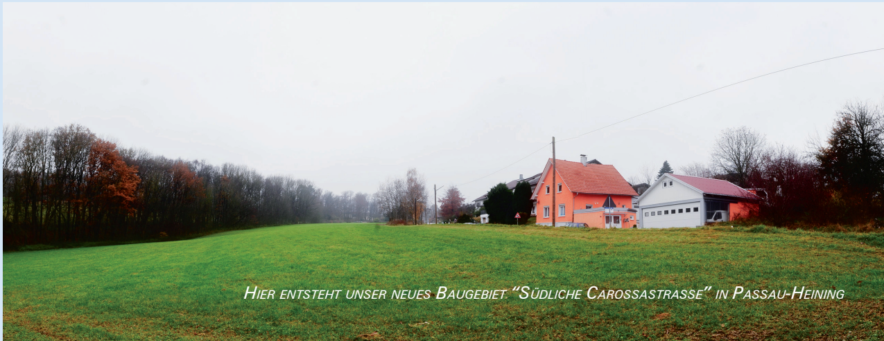
HIER ENTSTEHT UNSER NEUES BAUGEBIET "SÜDLICHE CAROSSASTRASSE" IN PASSAU-HEINING