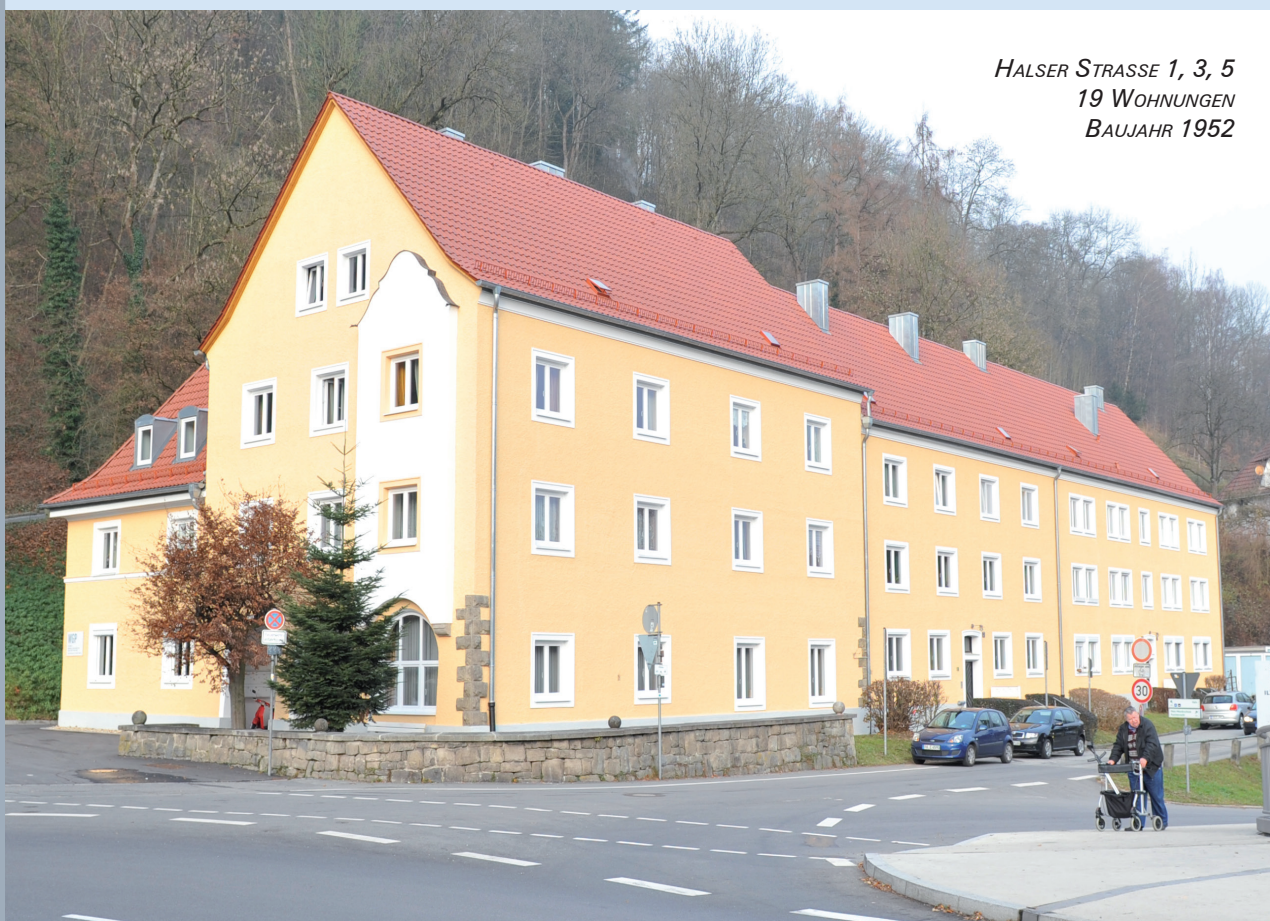
HALSER STRASSE 1, 3, 5 19 WOHNUNGEN BAUJAHR 1952