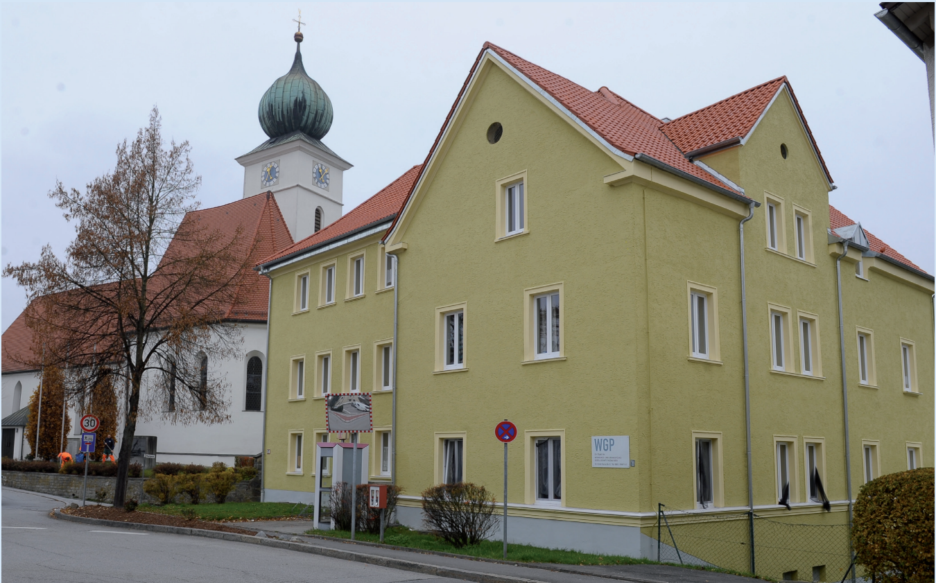
WOHNANLAGE HEININGER STRASSE 18 IN PASSAU