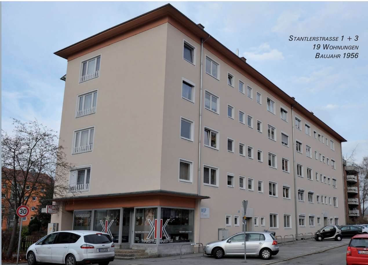
STANTLERSTRASSE 1 + 3 19 WOHNUNGEN BAUJAHR 1956