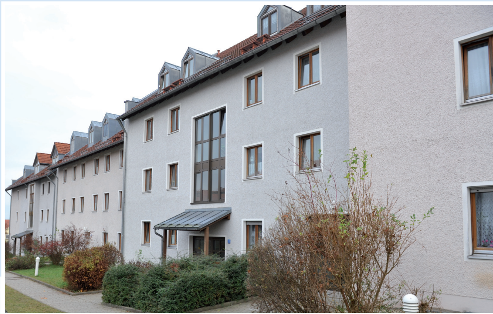
REINHARD-RAFFALT-STRASSE 8 - 18 UND SENEFELDERSTRASSE 1 + 3 79 WOHNUNGEN BAUJAHR 1993-1995