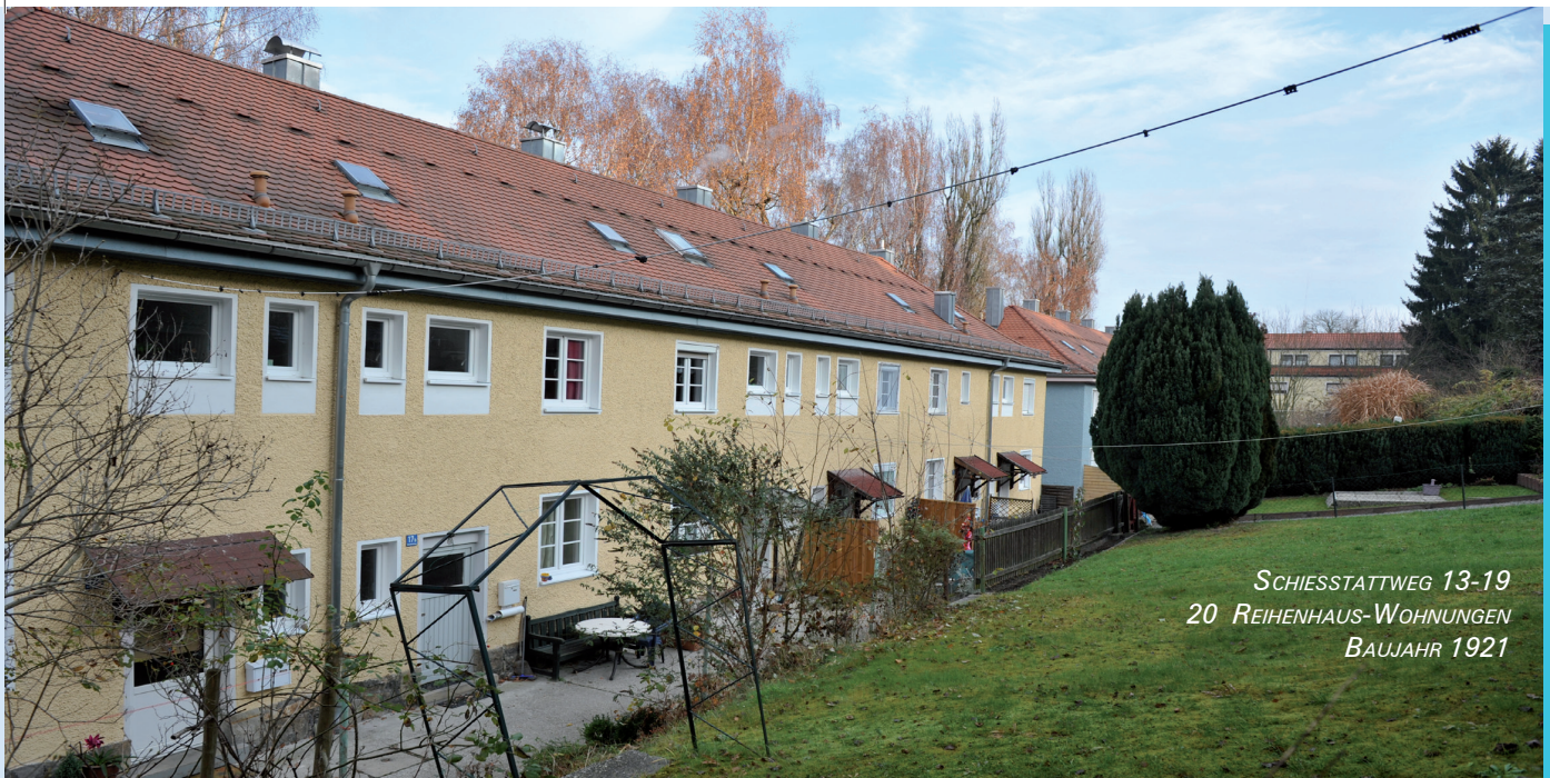
SCHIESSTATTWEG 13-19 20 REIHENHAUS-WOHNUNGEN BAUJAHR 1921