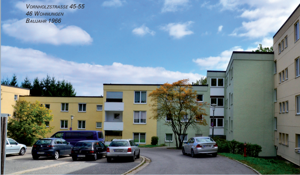
VORNHOLZSTRASSE 45-55 46 WOHNUNGEN BAUJAHR 1966