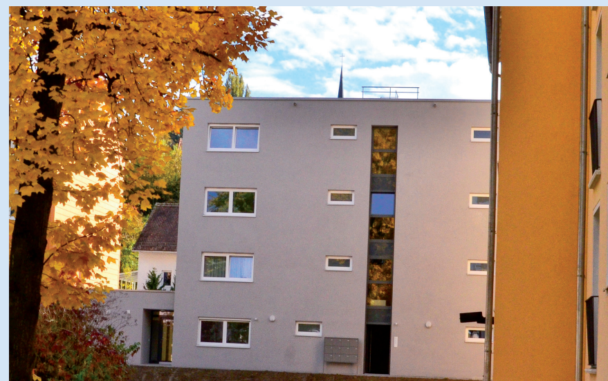
NORDSEITE - SCHIESSSTATTWEG 50