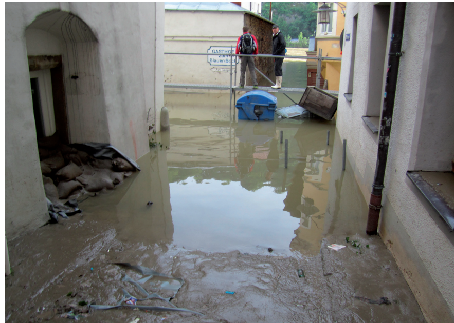
Ecke Höllgasse / Pfaffengasse