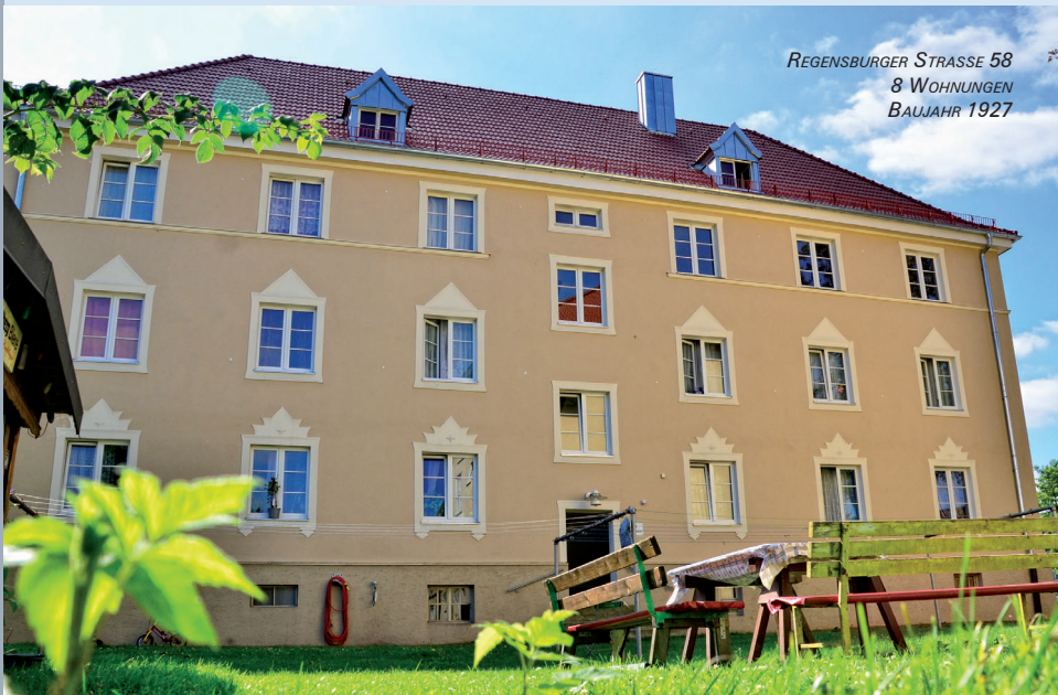
REGENSBURGER STRASSE 58 8 WOHNUNGEN BAUJAHR 1927