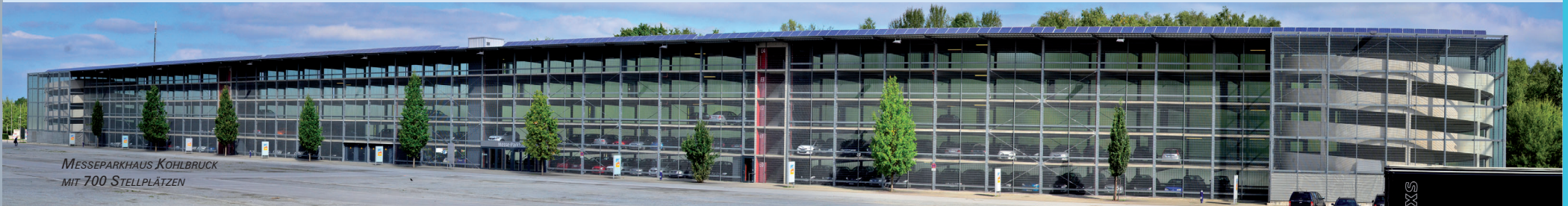
MESSEPARKHAUS KOHLBRUCK MIT 700 STELLPLÄTZEN