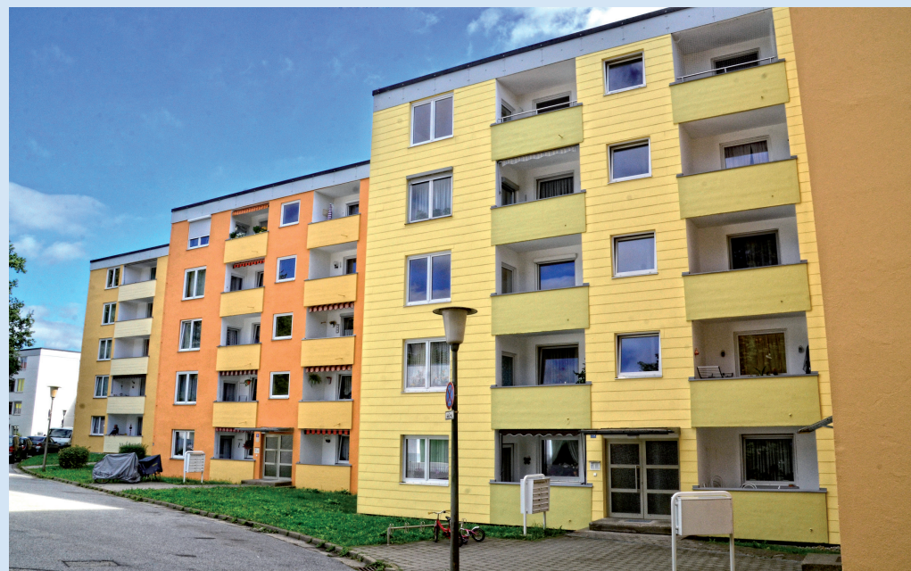
WOHNANLAGE VORNHOLZSTRASSE 65-77 IN PASSAU

Wir planen dort im nächsten Jahr den Neubau eines Mehrfamilienhauses mit 15 Mietwohnungen.