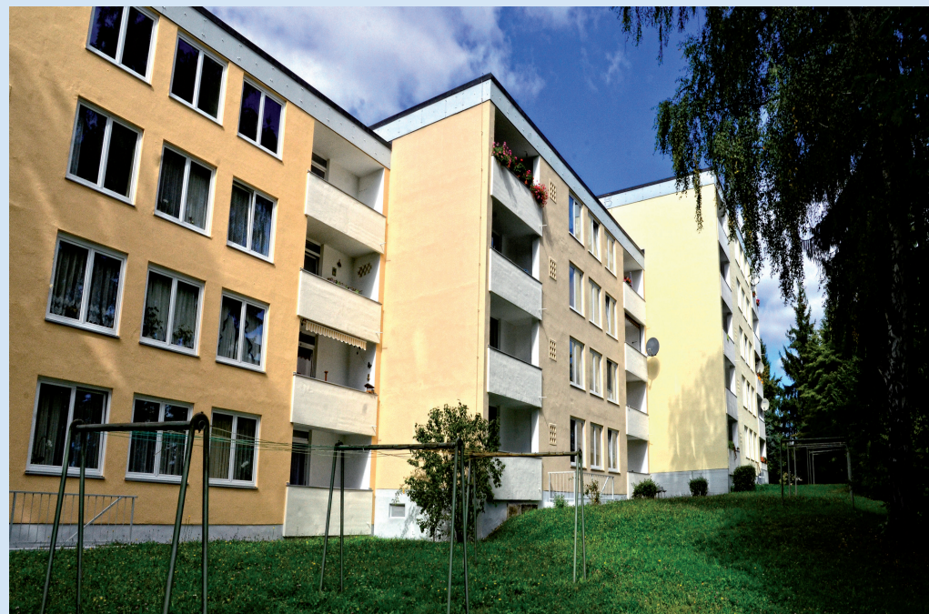
WOHNANLAGE VORNHOLZSTRASSE 57-61 IN PASSAU