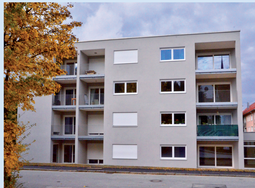
SÜDSEITE - SCHIESSSTATTWEG 50

Der Mietpreis liegt zwischen 6,50 Euro und 7,50 Euro pro Quadratmeter.